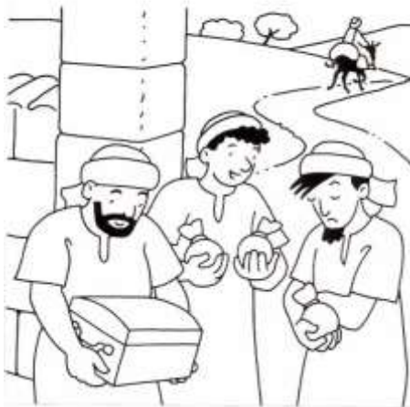
La parabola dei talenti